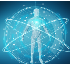
Nationalt Center for Autoimmune sygdomme

Med inspiration fra pjecen "It takes guts to talk" fra The European Federation of Crohn's & Ulcerative Colitis Association