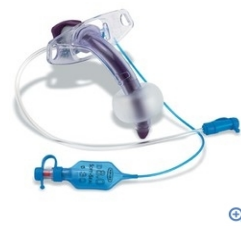
Portex blue line kanyle