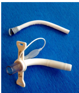
Bivona silikone tube