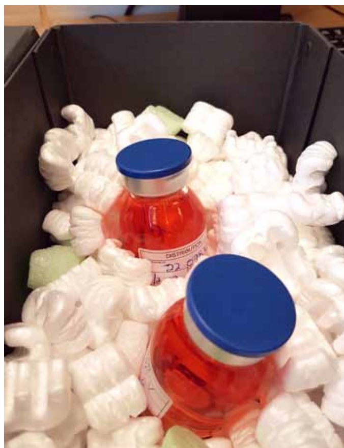
Figur 1 To hornhinder i lukkede glasflasker pakket og klar til afsendelse til kirurgen

teknikken muliggjorde, at donor-hornhindens ventede på patienten snarere end omvendt, ville det være perspektivrigt, hvis donor-hornhinder kunne nedfryses og opbevares i mange måneder, måske i mange år. Steffen Sperling og Niels Ehlers udforskede derfor kryo-præserving af hornhinder, og kryo-præservede hornhinder blev anvendt til patientbehandling, efter at vitaliteten af hornhinderne blev bekræftet efter optøning. I 2009 publiceredes en klinisk opfølgning af patienter transplanteret i 1978-79 med en kryo-præservede hornhinde, der viste, at 25% fortsat havde en klar og fungerende hornhinde (4) Teknikken blev dog opgivet i 1980, da en stor del af de nedfrosne hornhinder blev beskadiget under optøningen og derfor måtte kasseres.